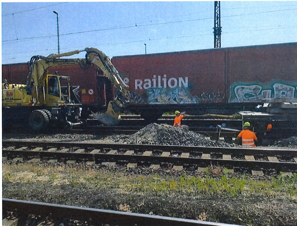
SZS-ZX49, žel. stanica Zohor, sžkm 12,835