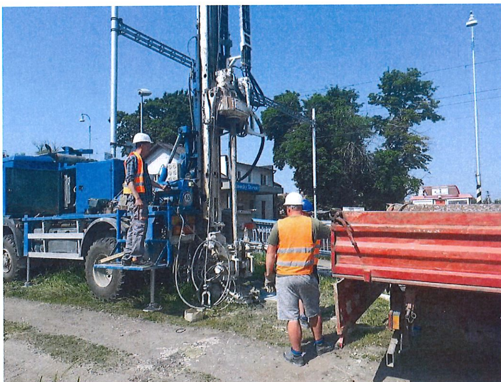
D-104, podjazd Plavecký Štvrtok, sžkm 18,008