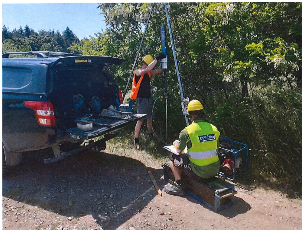
DPT-24, nadjazd, sžkm 15,341